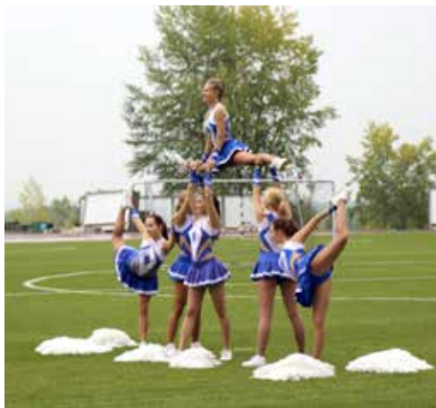
Спартакиада первокурсников. См. 4-ю стр.