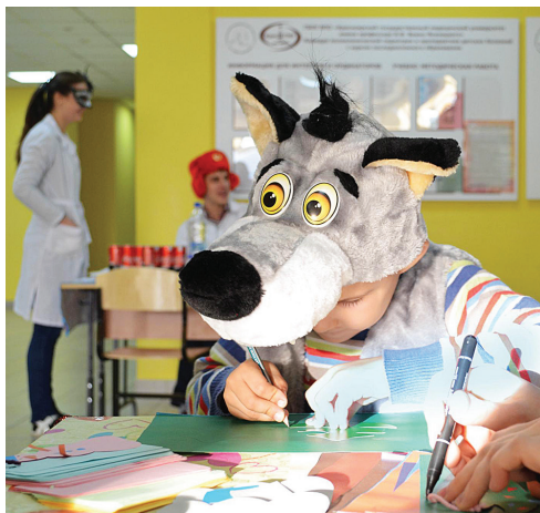
Творчество это всегда чудо. См. 3-ю стр.