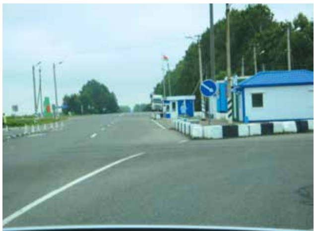
Так вот ты какая, граница....

А многое нам кажется вообще в диковинку. Ну, скажем, молодые специалисты в Белоруссии (все, без исключения!) получают от государства бесплатную (!) квартиру. (Окончание на 4-й стр.)