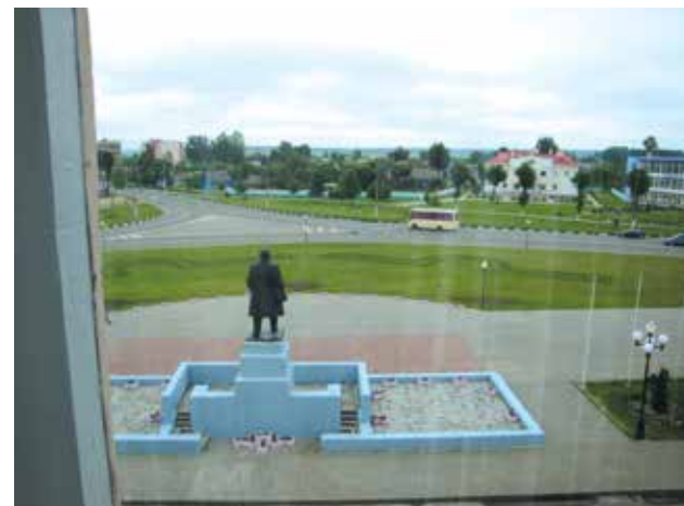
Знакомый вид из окна.