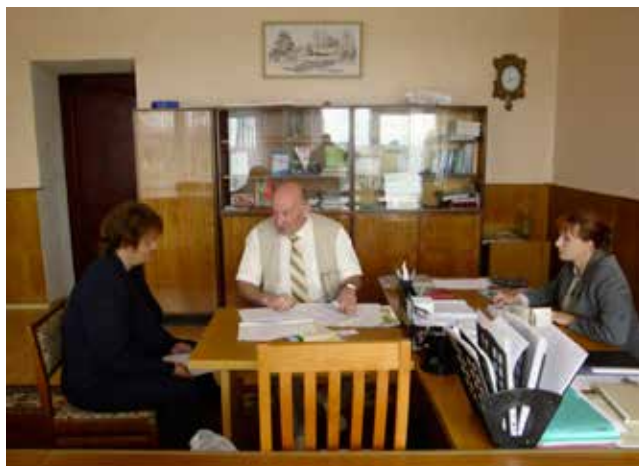
Душевный разговор. В Чериковском райисполкоме.