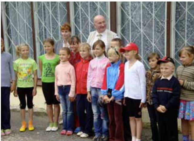
Даже белорусские дети почувствовали в нем педиатра!