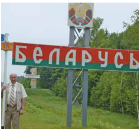
На родину предков....