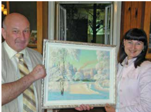
Подарок местному музею.