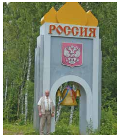
Россия, матушка Россия...

После обстоятельной беседы с заместителем главы района мы выходим осмолтаться в город, и сразу же попадаем