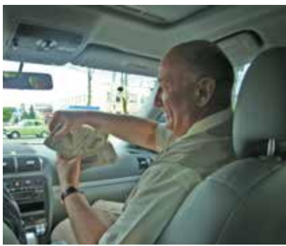
И куда теперь с этими деньгами?..

А земля здесь действительно прекрасная! Вокруг ухоженные поля, лиственные леса... И очень жаль, что от бывшей деревни Гойки ничего не осталось: взбешенные их сопротивление, гитлеровцы сожгли ее начисто, и теперь на месте бывших деревенских домов колосится щедрая пшеница, да о чем-то своем шумят березовые рощи.