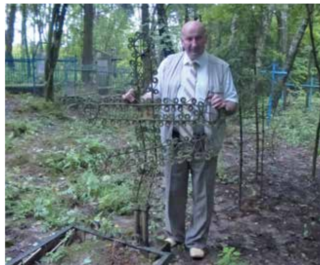
На сельском погосте..

ка, мы так и не растратили. себе «на память». Неподъемным оказалось Она и сейчас лежит это дело в условиях белорусского рынка. И уже подвезжая к символической помывка немаленькой, по границе между нашими государствами, я не удержался и выпросил у ректора одну белорусскую денежку.