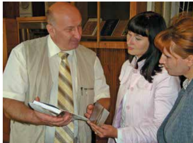
Теперь «Архитектора...» читают и на родине предков.