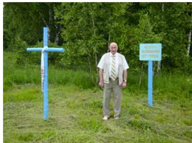
На месте деревни прадеда..