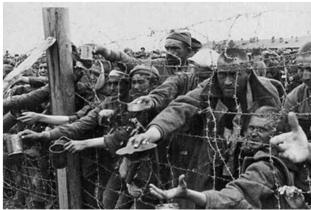
В таком вот лагере под Днепропетровском был и мой отец...

Полностью, повторюсь, снаряженный патронами и готовый к моментальному применению. Передерни только