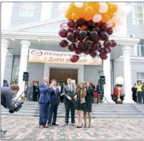
В КрасГМУ – праздник...