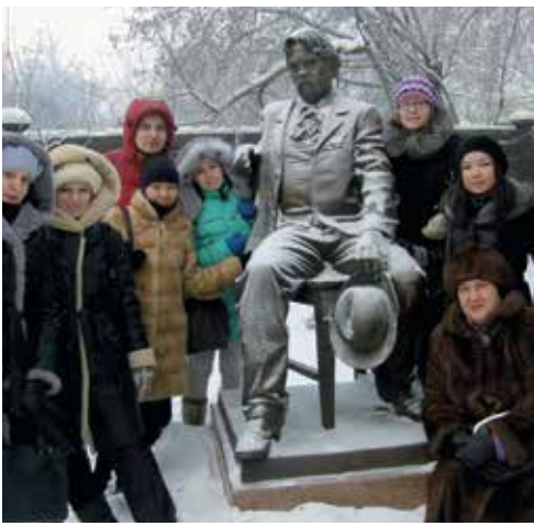
В гостях у Сурикова... См. 4-ю стр.