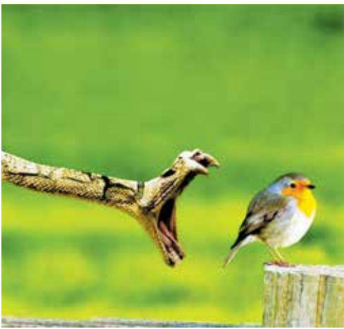
Со Змеею шутки плохи... См. 3-ю и 4-ю стр.