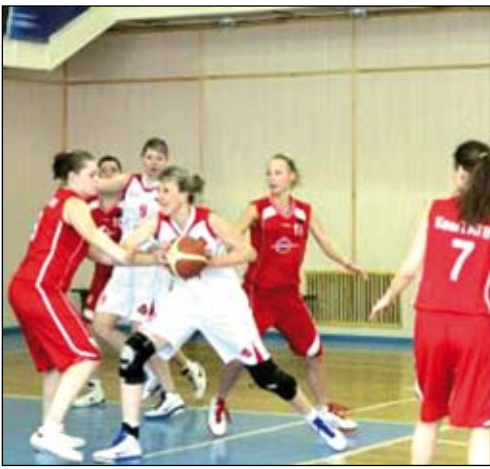
«Медик» рвется к победе...