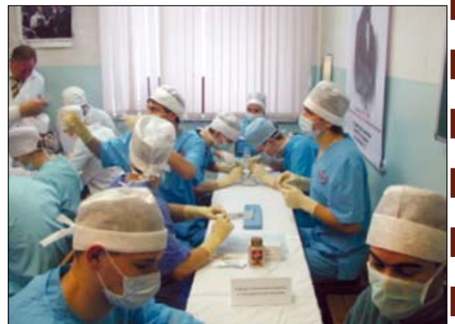
Олимпиада по хирургии.