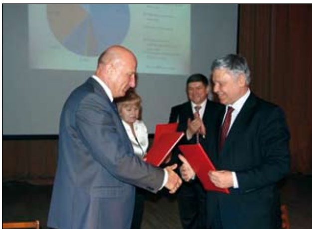
Подписание Договора о сотрудничестве.