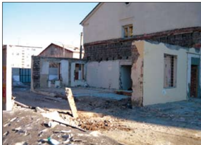
Мы развиваемся... Центр экспериментальных животных

Мы участвовали в восьми номинациях конкурса