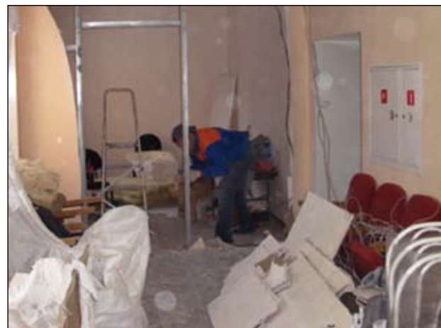
Мы развиваемся... Отделение врачебной практики

Продолжают активно работать уже широко зарекомендовавшие себя научные школы – Красноярская научная школа абдоминальной и гнойной хирургии (проф.