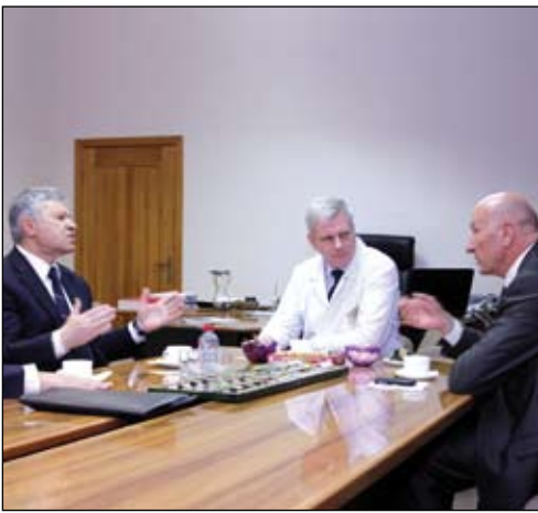
Разговор интересный... См. 4-ю стр.