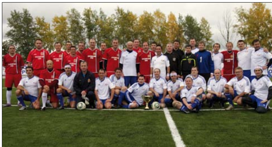
Здесь нет проигравших...

Весомый вклад в копилку международного сотрудничества КрасГМУ вносит Российско-Канадская ассоциированная лаборатория «БиоМет», а также Российско-Французское партнерство в области интегративной антропологии. Так что без ложной скромности можно заявить, что минувший год стал для