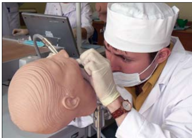
Межрегиональная олимпиада по стоматологии.