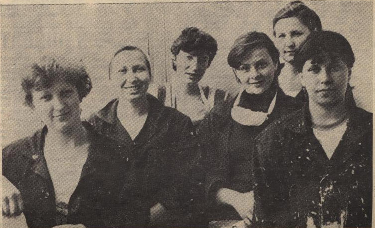
ССО «Альтаир» провел трудовое лето в Кожанах.