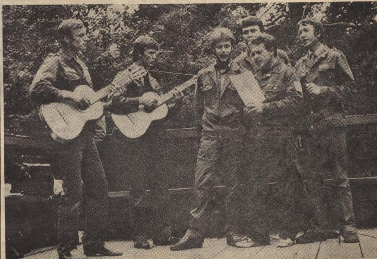
Фестиваль студенческих отрядов. Выступает агитбригада «Кварца».