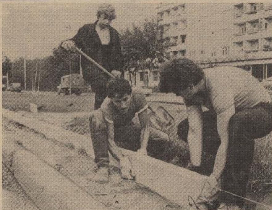
Хорошеет день ото дня Советский район. Немалая заслуга в этом и студентов Красноярского медицинского института.