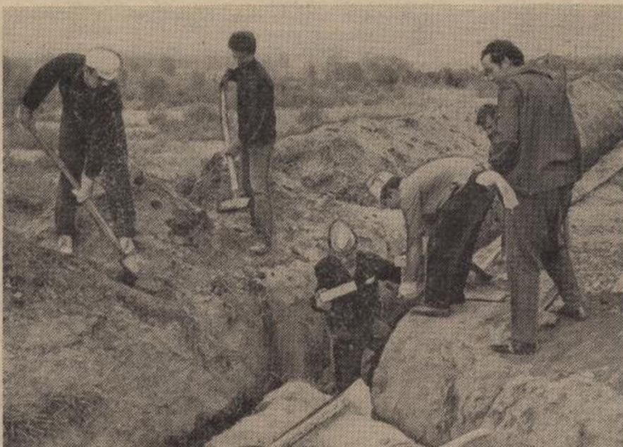
Бригада студентов № 1 — главной базы КГМИ трудится на строительстве корпусов краевой клинической больницы