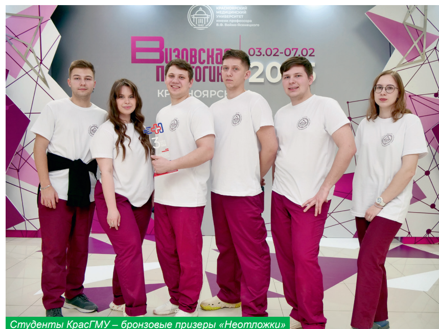
Студенты КрасГМУ – бронзовые призеры «Неотложки»