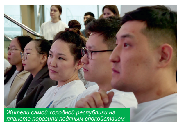
Жители самой холодной республики на планете поразили ледяным спокойствием