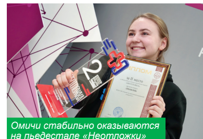
Омичи стабильно оказываются на пьедестале «Неотложки»