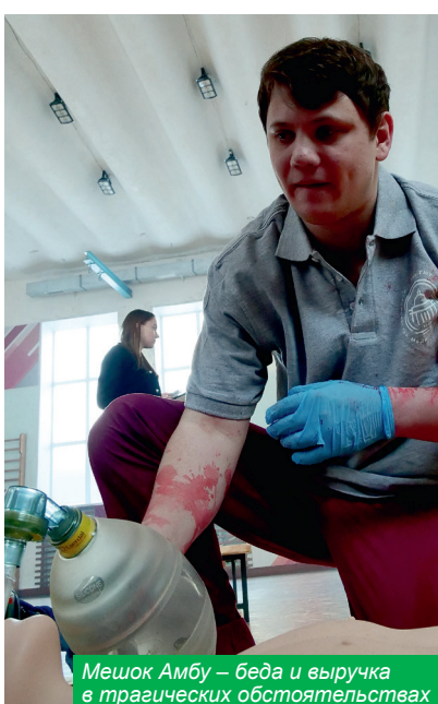
Мешок Амбу – беда и выручка в трагических обстоятельствах