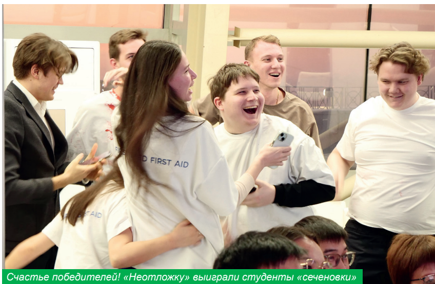
Счастье победителей! «Неотложку» выиграли студенты «сеченовки»

Педагогическая конференция – бренд нашего университета, ей уже почти два десятилетия. Есть уверенность, что с каждым годом она будет обогащаться новыми формами, креативом и талантливыми участниками.