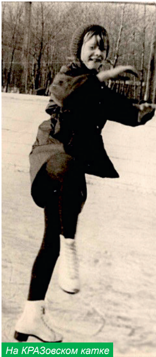
На КРАЗовском катке

– Рошинские мы. Сегодня сложно представить, что руководство алюминиевого завода в 1960–1970-е жило в «хрущевках» на улице Терешковой, в том числе моя семья – папа руководил трестом «Сибцветметремонт».