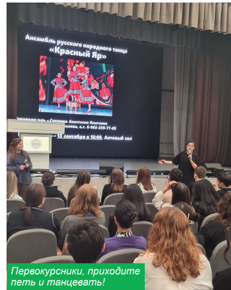
Первокурсники, приходите петь и танцевать!

Эти студенты пока вещь в себе, никто не может предсказать, кто и участников квеста «Тайна Alma Mater» будущий общественный активист. Но лидеры среди нескольких сотен человек, посетивших мероприятие, точно есть — скоро мы узнаем их имена.