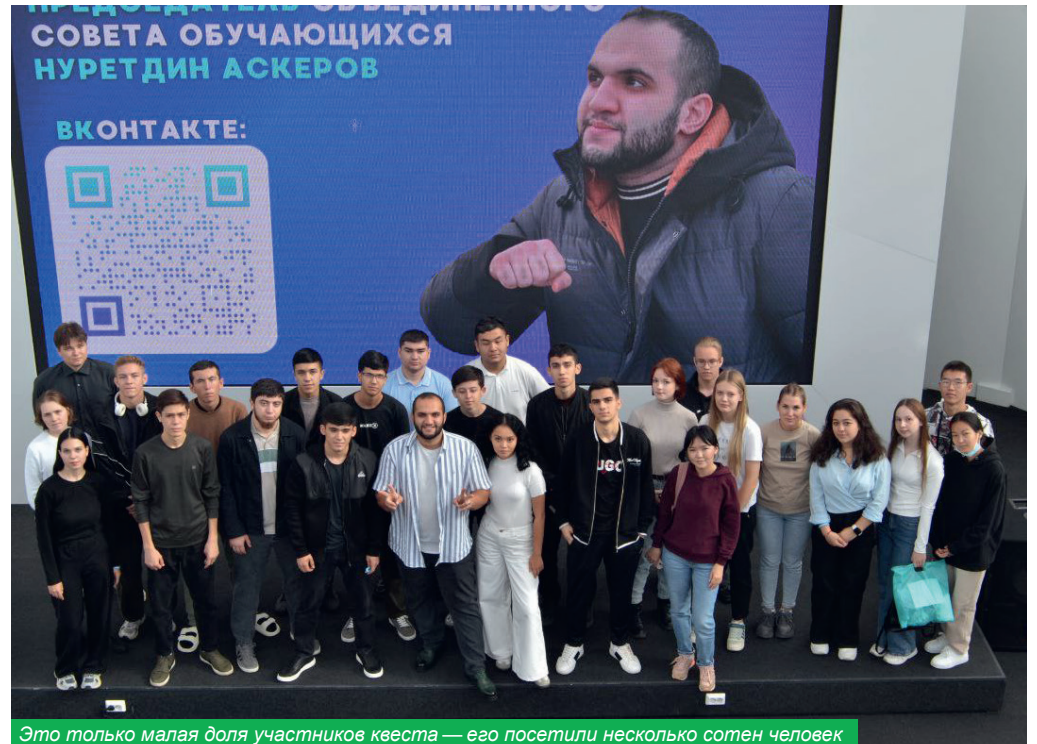
Это только малая доля участников квеста — его посетили несколько сотен человек

В расположенной напротив аудитории № 2 приветствовал студентов патриотический клуб.