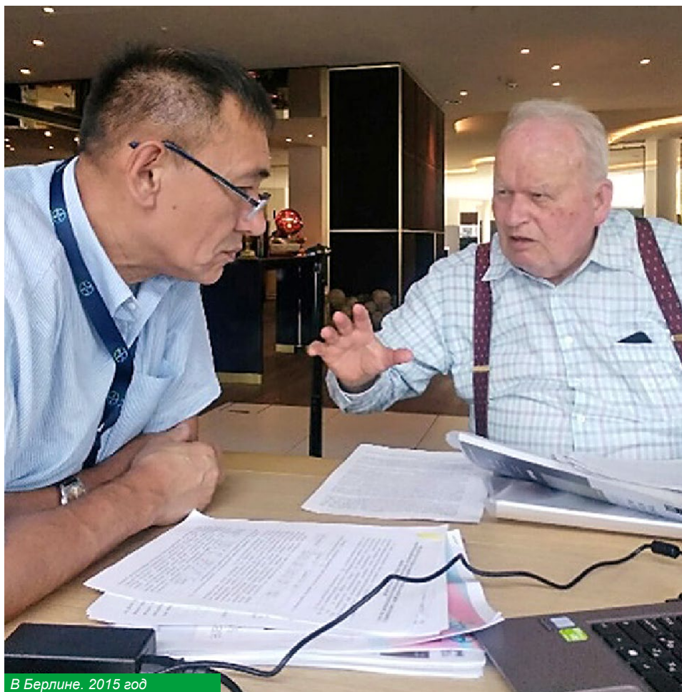
В Берлине. 2015 год

В 2012 году состоялась наша незабываемая поездка в этот город. Можно себе представить удивление и восторг енисейских акушеров-гинекологов