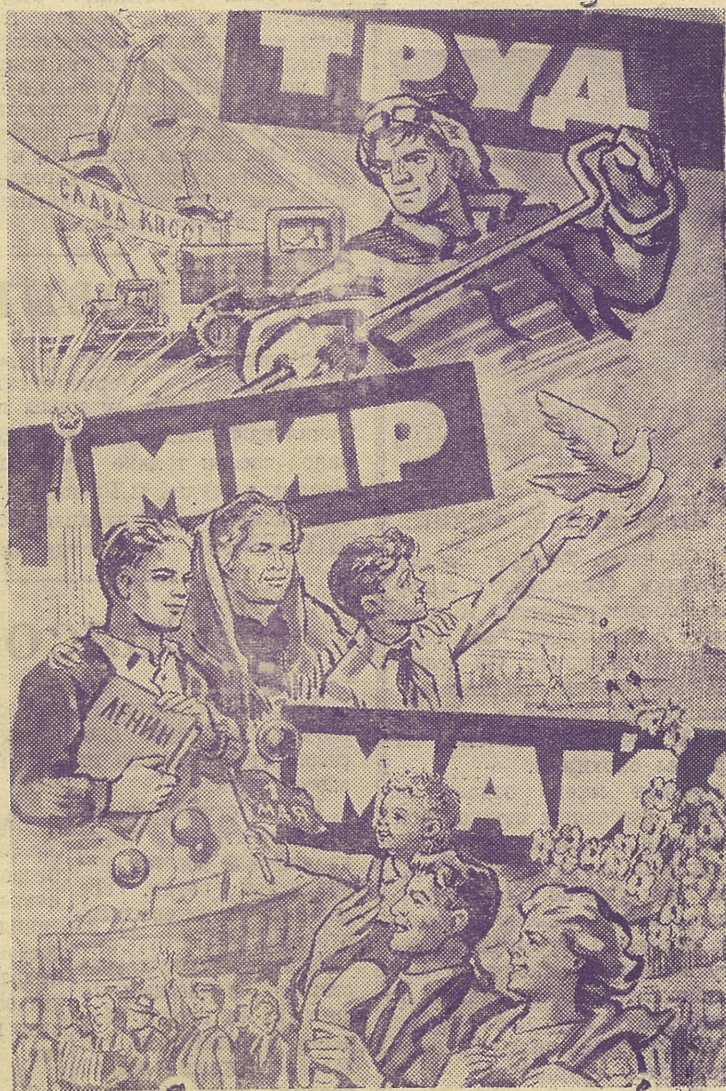
Планат художника В. Жаринова.