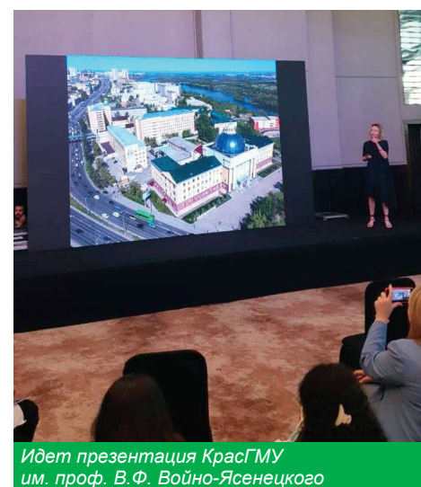
Идет презентация КрасГМУ им. проф. В.Ф. Войно-Ясенецкого

Они приедут в наш мир, совершенно незнакомый, чужой. Им будет сложно привыкнуть, но желание стать врачом – сильнее.