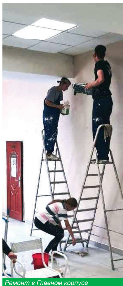
Ремонт в Главном корпусе