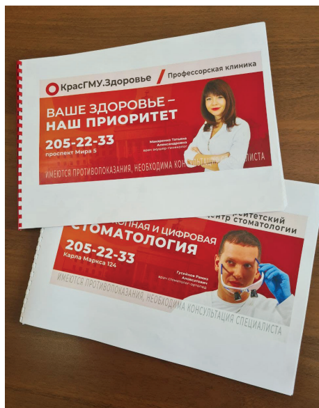
Билборды профессорской клиники размещены на улицах Красноярска