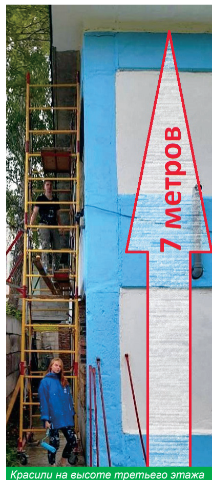
Красили на высоте третьего этажа