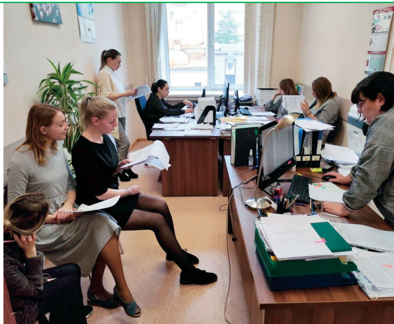
Мозговой штурм – разрабатывается регламент закупок