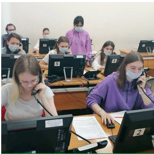
Позвонки работали по восемь часов в день