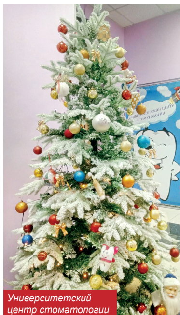
Университетский центр стоматологии