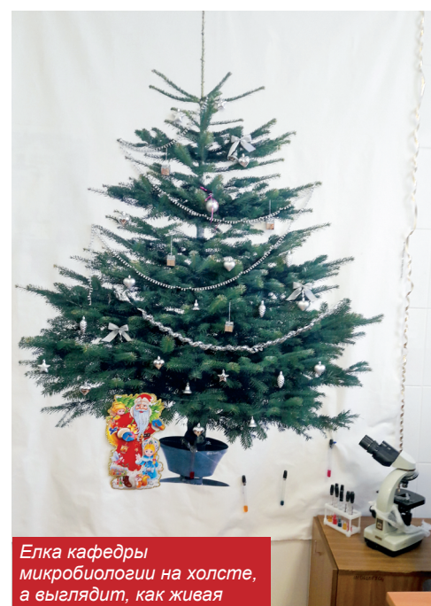
Елка кафедры микробиологии на холсте, а выглядит, как живая