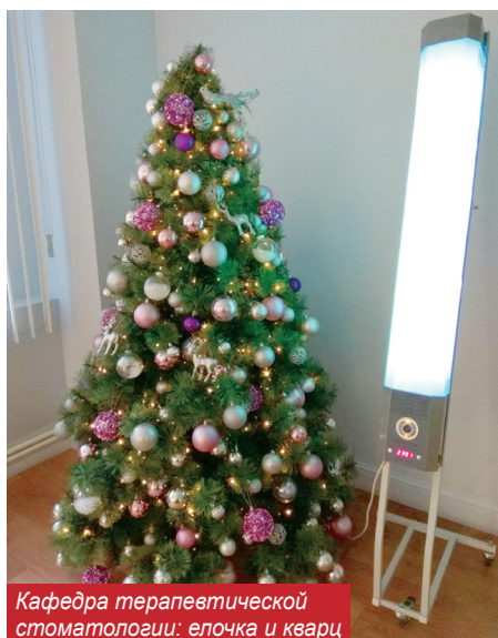
Кафедра терапевтической стоматологии: елочка и кварц