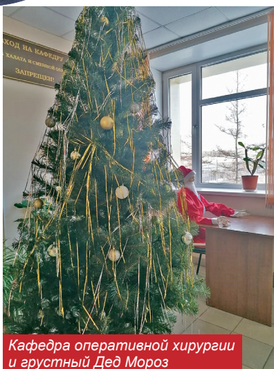
Кафедра оперативной хирургии и грустный Дед Мороз