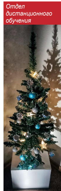
Отдел дистанционного обучения