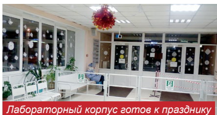
Лабораторный корпус готов к празднику