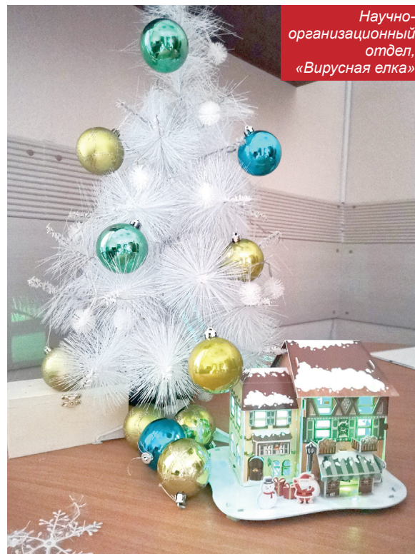
Научно-организационный отдел, «Вирусная елка»

Елочку нашу украсили дети, Им от года до двадцати... И она всех прекрасней на свете Манит веточкой: приходи. Каждый шарик принес с пожеланием счастья, Чтоб в родной универ не прокралось ненастье. Чтобы в Новом году улыбались и пели, Будут нам нипочем и пурга и метели! Мы Covid победим, мы всегда впереди, Он нисколько не круче сибирской зимы, Дед Мороз, ты на елочку к нам приходи, Будем рады и счастливы мы!