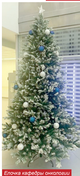
Елочка кафедры онкологии