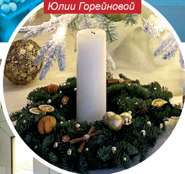
Венок студентки Юлии Горейновой