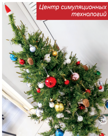
Центр симуляционных технологий