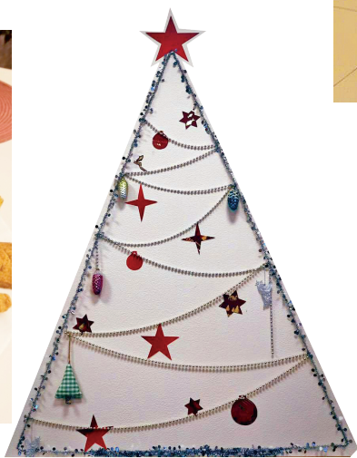
Управление экономики и финансов