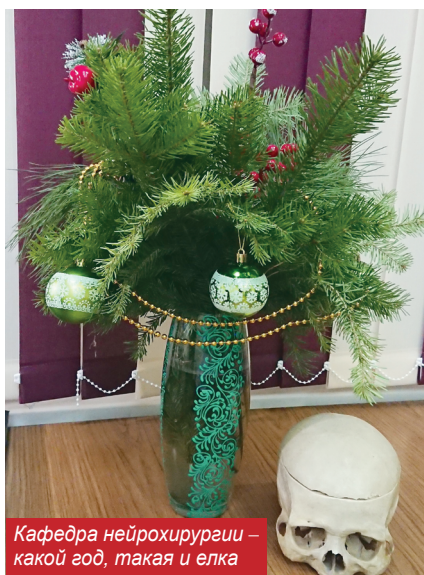
Кафедра нейрохирургии – какой год, такая и елка