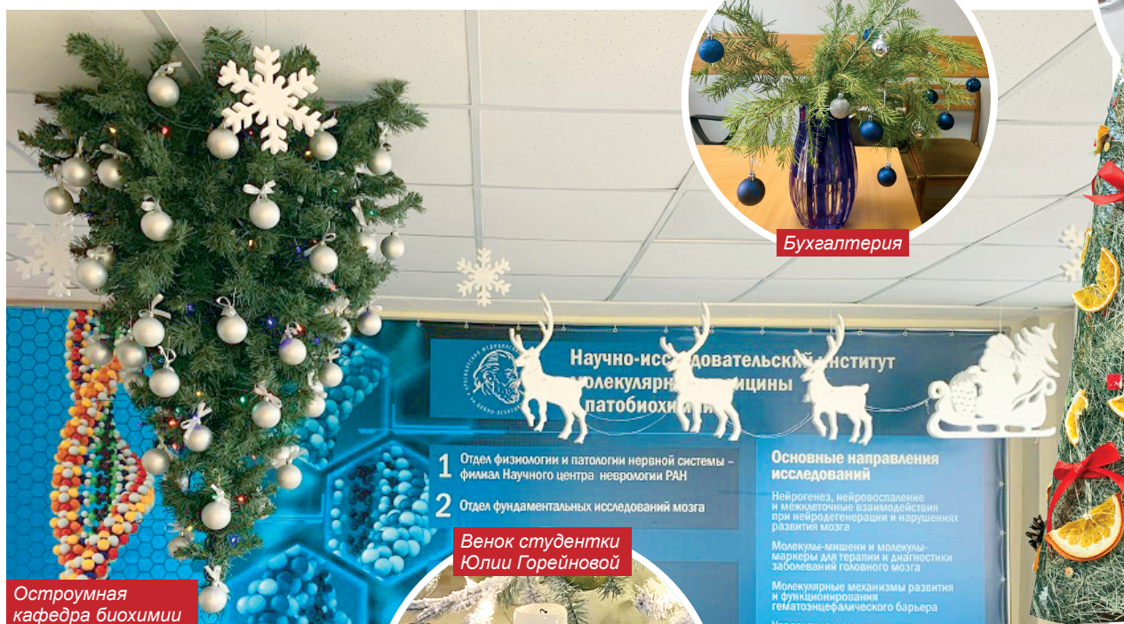
Остроумная кафедра биохимии