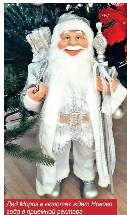
Дед Мороз в кютах ждет Нового года в приемной ректора