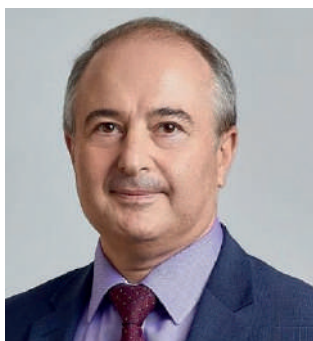
НЕМИК Борис Маркович

к.м.н., и.о. министра здравоохранения Красноярского края