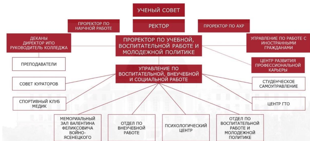
Рис. 1 – Структура воспитательной работы и молодежной политики в КрасГМУ.

11.4 Работу по организации спортивного воспитания обучающихся и организации спортивных мероприятий во внеучебное время осуществляется путем совместной работы структурных подразделений Университета: Спортивного Клуба «Медик» и кафедры физической культуры.