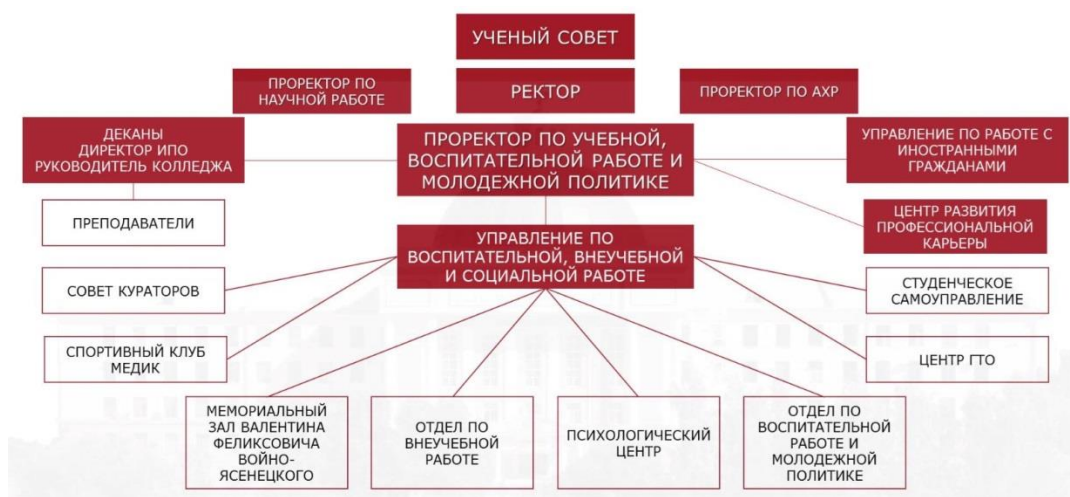
Рис. 1 – Структура воспитательной работы и молодежной политики в КрасГМУ.

12.4 Работу по организации спортивного воспитания обучающихся и организации спортивных мероприятий во внеучебное время осуществляется путем совместной работы структурных подразделений Университета: Спортивного Клуба «Медик» и кафедры физической культуры.