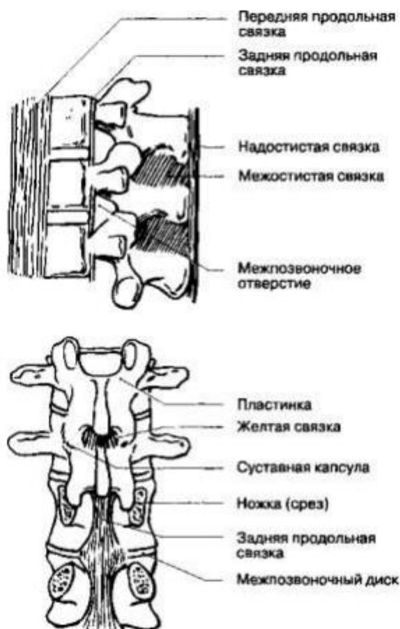
Рис. 16-3. Связки позвоночного столба

Спина́й моз́г находится в позвоночном канале. Покрывающие его ткани, включая твердую мозговую оболочку, жировую ткань и венозные сплетения, называются мозговыми оболочками, meninges (рис. 16-4). Спина́й моз́г окружен твердой мозговой оболочкой, представляющей собой плотную, непроницаемую для жидкости трубку, защищающую спинной мозг и содержащую цереброспинальную жидкость. Снаружи от твердой мозговой оболочки находится эпидуральное пространство, в котором расположены вены и жировая соединительная ткань.