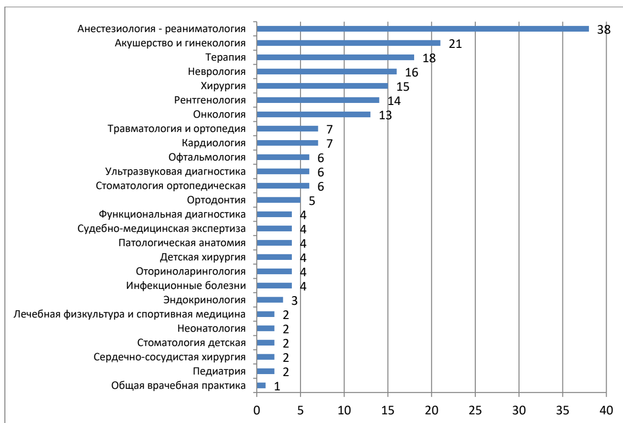
Рисунок 1 – Количество опрошенных ординаторов по специальностям

Свою удовлетворенность респонденты выражают в % соотношении случаев, результаты представлены в таблице 6.