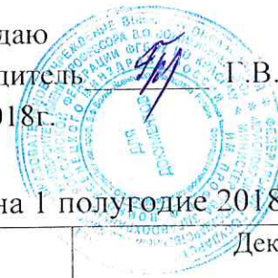
График учебного процесса по специальности 31.02.03 Лабораторная диагностика на I полугодие 2018-2019 уч.г.