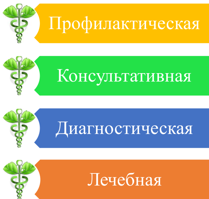
Рис.1 «Виды помощи, оказываемые детской поликлиникой»

Детская стоматологическая поликлиника (отделение) (далее - Поликлиника) является самостоятельной медицинской организацией или структурным подразделением медицинской организации и создается для осуществления (Рис.1) профилактической, консультативной, диагностической и лечебной помощи детям со стоматологическими заболеваниями, не предусматривающей круглосуточного медицинского наблюдения и лечения. (п.2).