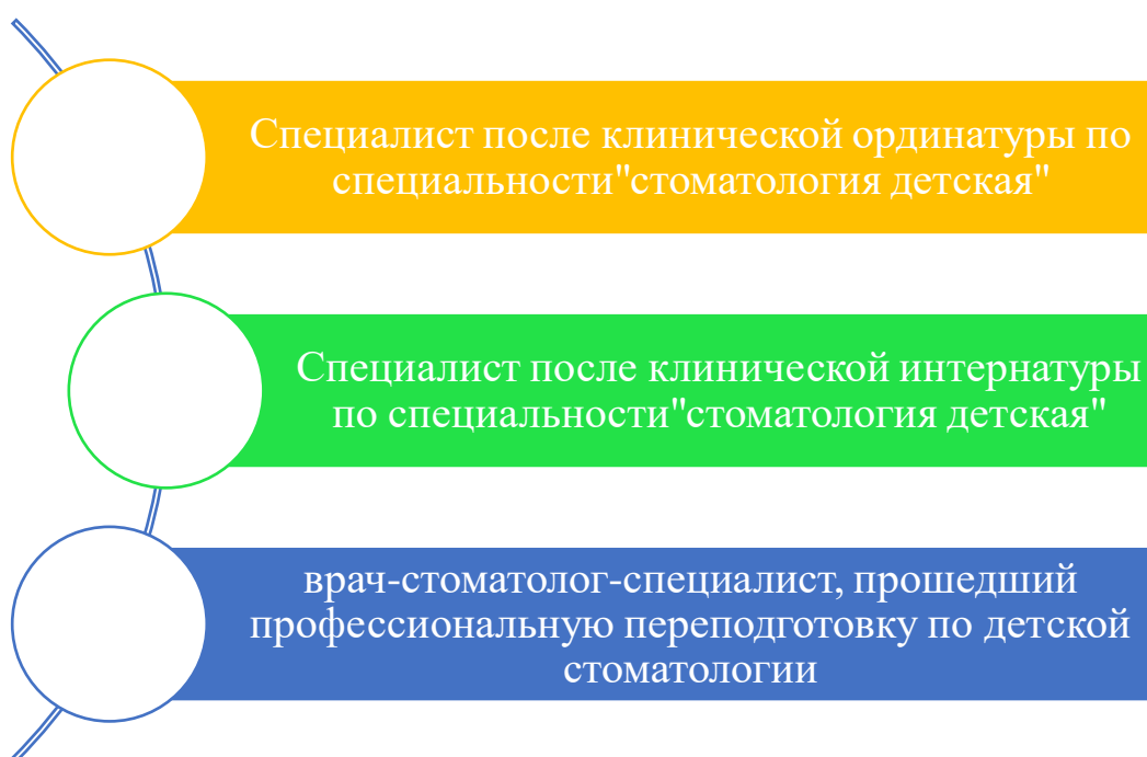
Рис.5 «Специалисты, работающие в должности врач-стоматолог детский»

Профессиональную деятельность в должности врача-стоматолога детского осуществляет специалист, получивший высшее профессиональное образование по специальности "стоматология" и окончивший интернатуру или клиническую ординатуру по специальности "стоматология детская", а также врач-стоматолог-специалист (терапевт, хирург, ортопед, ортодонт), прошедший профессиональную переподготовку по детской стоматологии в соответствии с требованиями образовательного стандарта, типовой программы и учебного плана, утвержденных в установленном порядке, и получивший сертификат специалиста по соответствующей специальности.