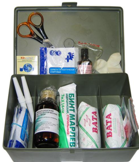
Рис. 4 «Аптечка Анти-СПИД»