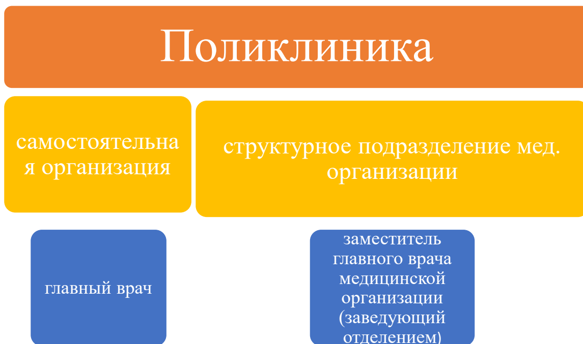
Рис. 2 «Руководство Поликлиникой»

Штатная численность Поликлиники устанавливается руководителем медицинской организации исходя из объема проводимой лечебно-диагностической работы и численности детей на обслуживаемой территории с учетом рекомендуемых штатных нормативов, предусмотренных приложением N 8 к Порядку оказания медицинской помощи детям со стоматологическими заболеваниями, утвержденному настоящим приказом. (п.7).